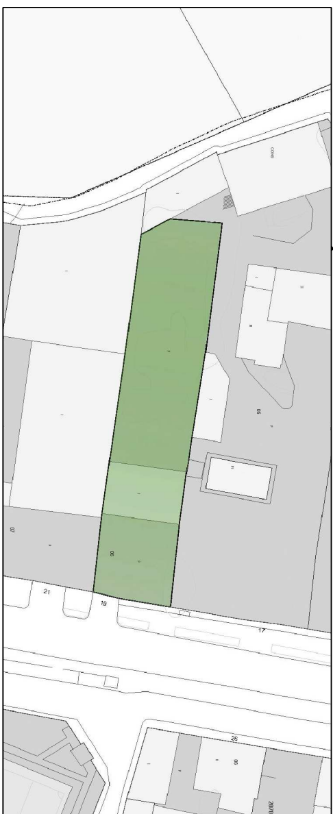
PLANTA CATASTRAL DE SITUACIÓN Y EMPLAZAMIENTO [E: 1/1000]

ESTUDIO DE DETALLE AMPLIACIÓN DE VIARIO PÚBLICO